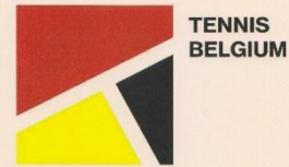
X. de Leenheer